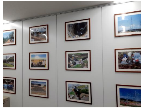
[写真・絵画の展示]