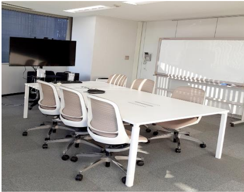
[新たな会議スペース]